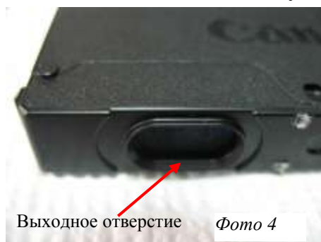
Выходное отверстие Фото 4